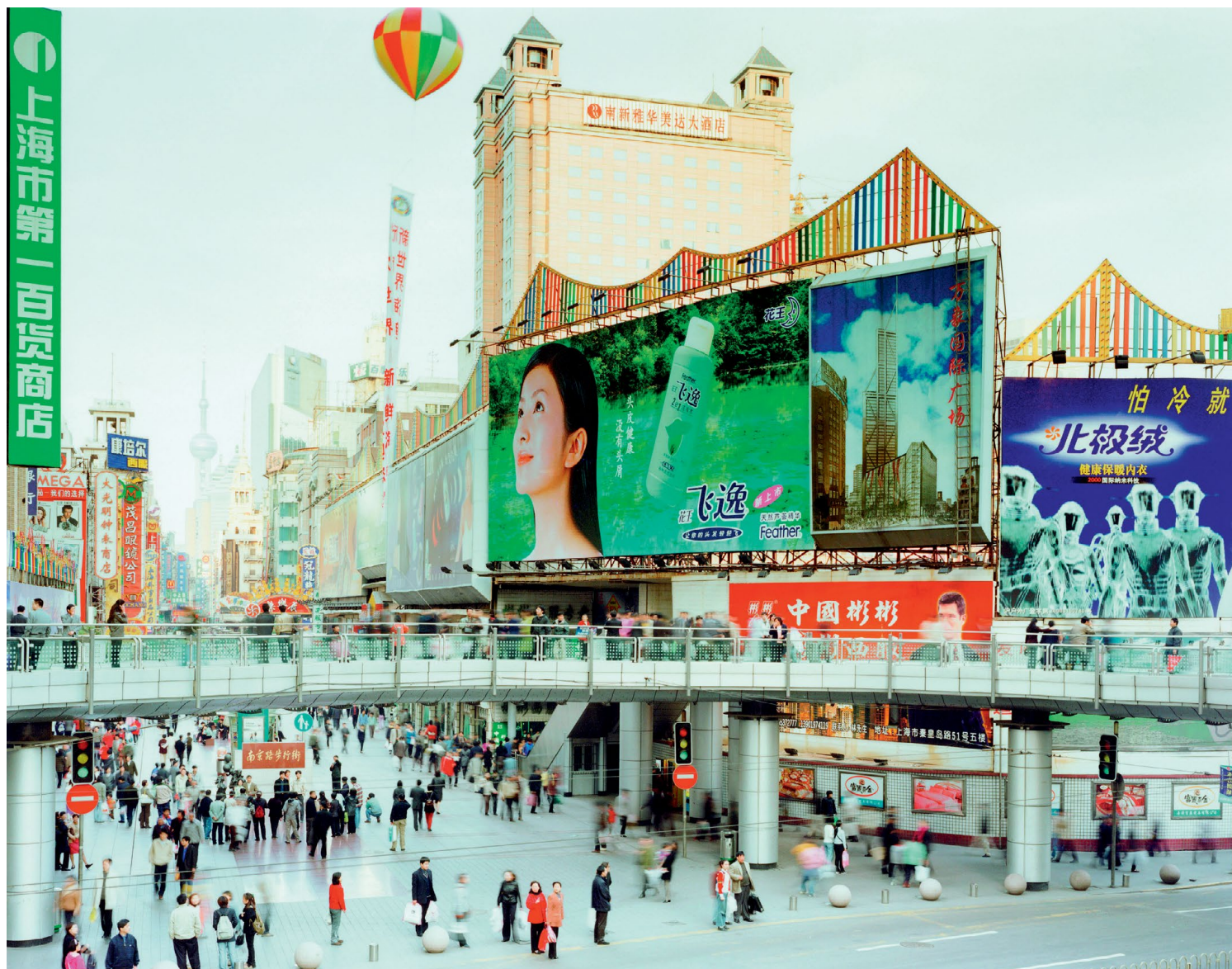
Peter Bialobrzeski har med sina bilder vunnit mängder av priser och haft utställningar världen runt.

– De flesta tror det inte, men jag åker alltid med kollektivtrafik och som gammal backpacker försöker jag göra av med så lite pengar som möjligt.