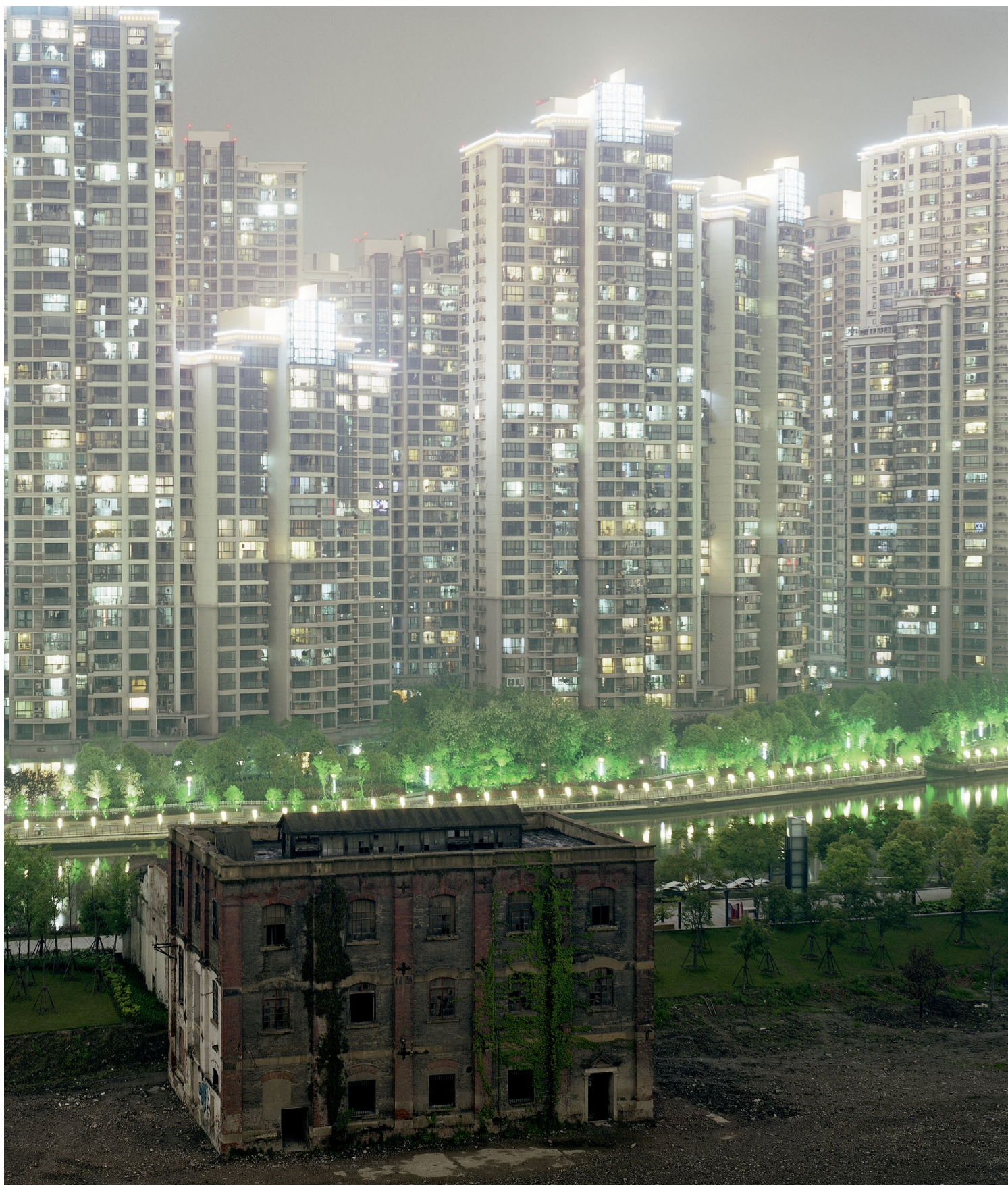
Den tyske fotografen Peter Bialobrzeski har alltid fascinerats av stora städer, inte minst de som finns i Asien.