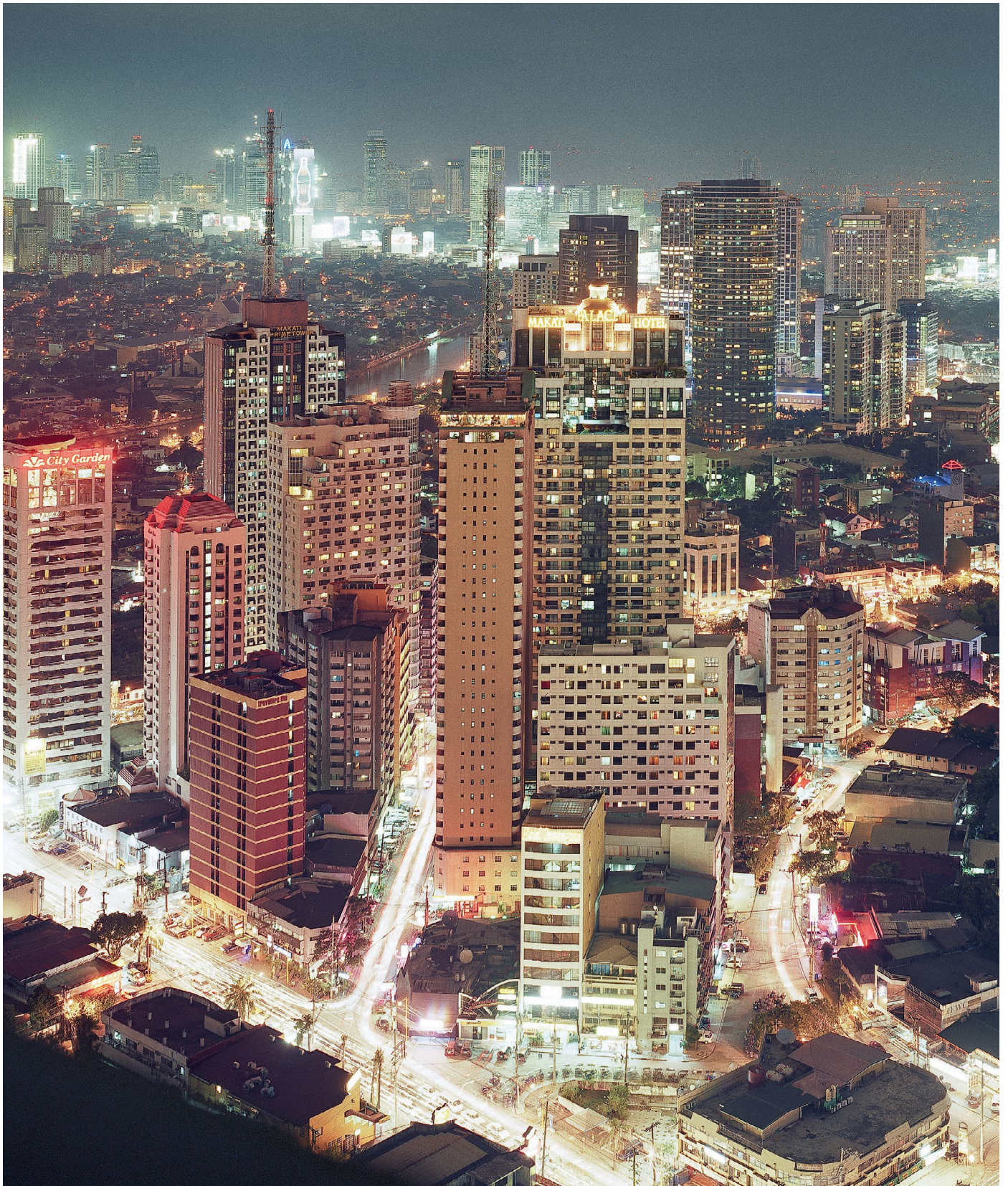
Högt ovanför kaoset och trängseln på gatan ser staden nästan lugn ut.